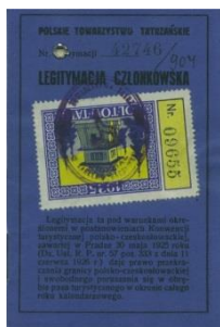
Legitymacja członkowska PTT