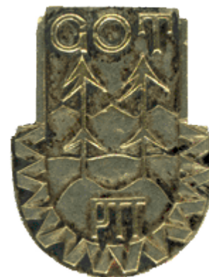
Górska Odznaka Turystyczna z 1935 r wg projektu Stefana Osieckiego

Najstarszą odznaką turystyczną, istniejącą w Polskim Towarzystwie Tatrzańskim (PTT) od 1935 r., jest Górska Odznaka Turystyczna (GOT) . Stanowiła wzór, na podstawie którego opracowano zasady zdobywania odznak w innych dyscyplinach turystyki kwalifikowanej. Obecnie można ją zdobywać, począwszy od 10. roku życia, na górskich szlakach znakowanych, według ustalonych zasad podanych w Regulaminie GOT, w okresie od 15 marca do 15 grudnia.